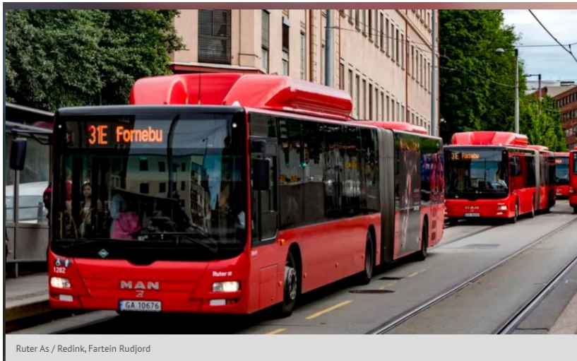
Ruter As / Redink, Fartein Rudjord

Hvordan kan bussbransjen bidra til økt trafiksikkerhet?